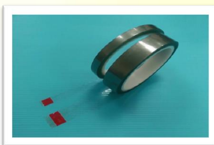
ESD 透明膠帶 表面阻抗: 10^6 \sim 10^9