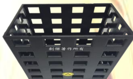
ESD 筆筒 表面阻抗: 10^6 \sim 10^9 尺寸:長 8 x 寬 8x 高 10cm