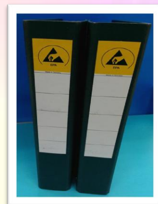
ESD 卷宗夾 表面阻抗: 10^6 \sim 10^9