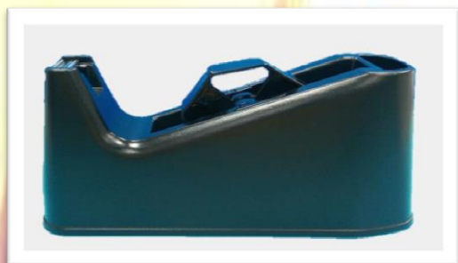
ESD 膠台 表面阻抗: 10^6 \sim 10^9