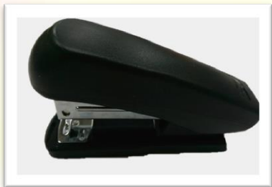
ESD 釘書機 表面阻抗: 10^6 \sim 10^9