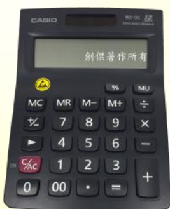
ESD 計算機 表面阻抗: 10^6 \sim 10^9