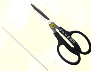
ESD 剪刀 表面阻抗: 10^6 \sim 10^9